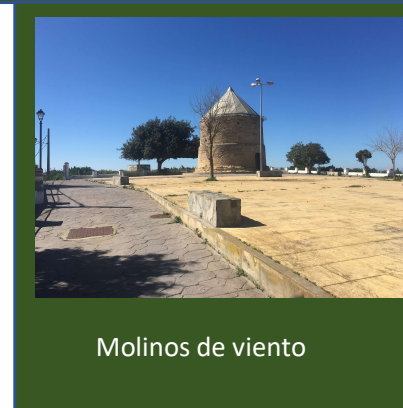
Molinos de viento