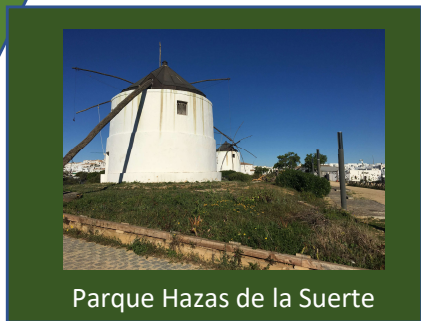
Parque Hazas de la Suerte

Su realización no es excesivamente complicada, excepto el tramo del sendero de subida entre los kilómetros 5,700 y 7,500, donde tendremos que superar un desnivel de 90 metros para alcanzar la cota más alta del recorrido (216 mtrs).