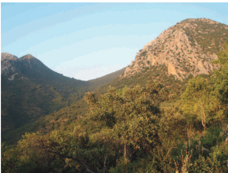
Vista de la Atalaya

partir de este punto la vereda asciende zigzagueando para evitar la fuerte pendiente. Nos encontramos en un denso encinar con palmitos y lentiscos. En algunos tramos cortos, el sendero discurre por roca desnuda. Aunque la pendiente es moderada, en unos minutos coronamos la loma, quedando la Cruz de la Atalaya. Las vistas desde aquí son soberbias. Benamahoma a nuestros pies, y parte del Área de Reserva tras nosotros