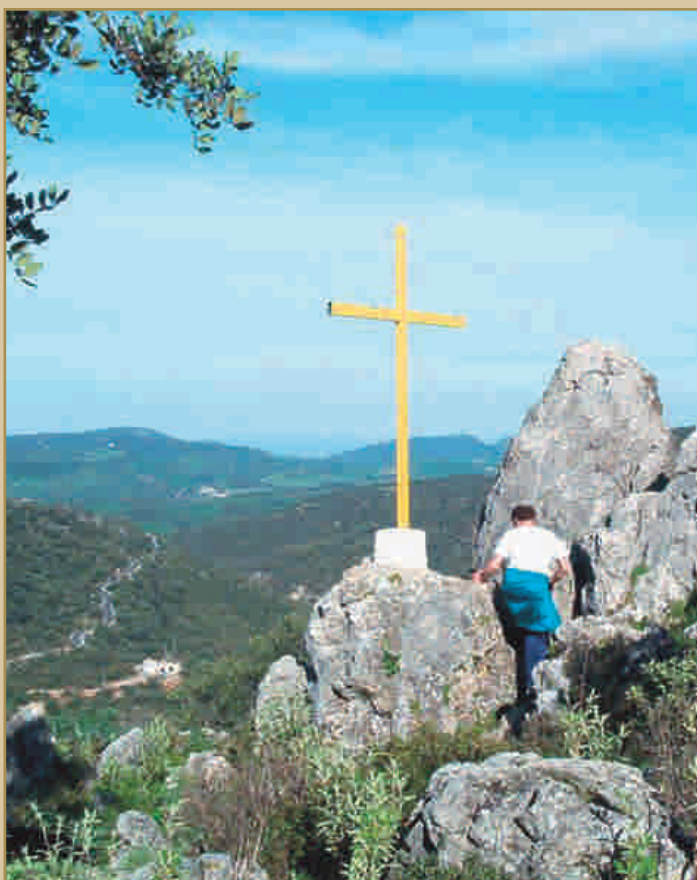
Cruz de la Atalaya

Este torreón natural que corona al pueblo de Benamahoma se ubica cerca de las ruinas de una fortaleza árabe. Con la cristianización del lugar y la llegada de las órdenes religiosas, el clero de la época coloca el símbolo de la cruz como conmemoración de la ocupación del pueblo por los cristianos. Dicho símbolo adquiere su fisonomía actual con la llegada en la década de los cincuenta de un grupo de misioneros que regalan al pueblo la actual cruz y la ubican coronándolo como forma de recordar su llegada y proteger al mismo en nombre de Dios frente a su origen árabe.