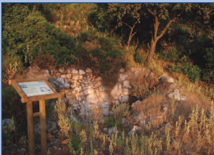
Calerilla o calera

La cal se utilizaba como amalgama para unir piedras o ladrillos. También como pintura. Aún hoy es común en estos pueblos “el encalijo”, que consiste en pintar con cal las fachadas de las casas, dándole ese característico color blanco a estos municipios. Por último, la cal es un desinfectante.