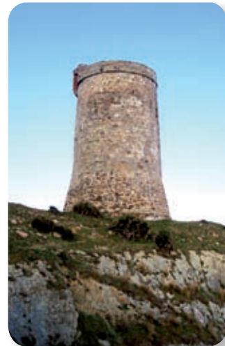
La torre de Guadalmesí tuvo como misión la defensa del único punto de abastecimiento posible de agua que se mantenía durante todo el año.

La zona que recorreremos [3] es cazadero frecuentado por rapaces y paso obligado en las rutas migratorias de aves, lo que permite la observación de muchas de ellas, como el milano real, especie residente, considerada entre las más elegante de cuantas habitan en la península por su fascinante y acrobático vuelo.