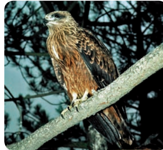
El mecanismo de vuelo de las aves planeadoras consiste en aprovechar las corrientes de aire ascendente para tomar altura y planear con un gasto energético mínimo. La ausencia de estas corrientes en el mar les obliga a buscar los pasos más estrechos entre el continente europeo y el africano: el de Gibraltar y el del Bósforo. La espera de condiciones favorables para la travesía llega a reunir en esta zona gran número de aves, llegándose a contabilizar hasta tres mil milanos negros en un sólo día (como el ejemplar joven de la fotografía).