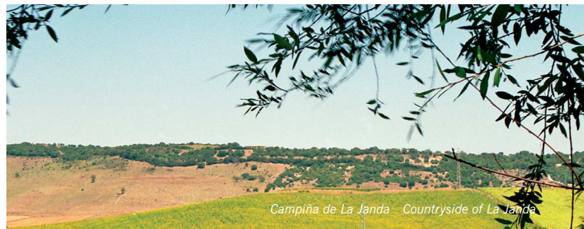
Campiña de La Janda. Countryside of La Janda

The track enters the small village of San José de Malcocinado, also known as La Yeguada due to the military stud that settled there until the Second Republic. All along the route from Cantarranas to San José de Malcocinado there are wonderful views of fields and dense Mediterranean scrubland, mainly made up of holm oaks; on occasions there are also areas of pastureland, like the Dehesa (rangeland) Montero. As well as these typical formations, one comes