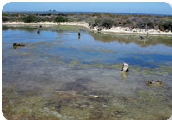
Se llama Saco de la Bahía a la extensión ocupada por aguas pocas profundas que constituyen las planicies mareales, praderas submarinas donde plantas especializadas procuran refugio y alimento a aves y peces. Incluye los bordes de fango y limo de San Fernando, Puerto Real y la isla del Trocadero.

Una vez atravesada la cancela, seguiremos por el carril que discurre paralelo al mal llamado río Arillo [2], hoy reducido a un caño de marisma que nos adentra en la bahía hasta llegar a un observatorio, desde el que no será difícil descubrir correlimos, chorlitos, archibebes, agujas u ostreros.