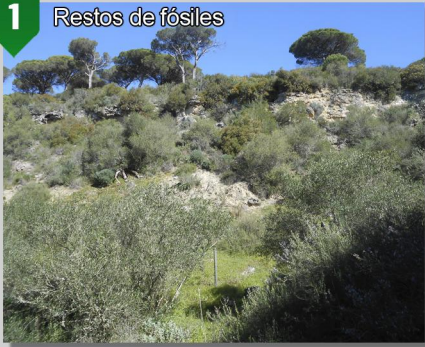
Restos de fósiles