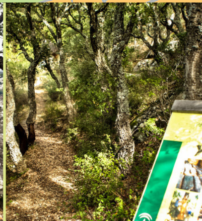
Tramo del sendero