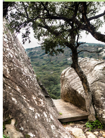
Entrada al mirador "De la Grieta"