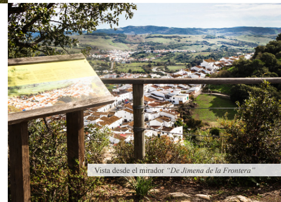
Vista desde el mirador “ De Jimena de la Frontera ”

Para finalizar el recorrido de forma completa es aconsejable no marcharse sin visitar el mirador “ De Jimena de la Frontera ” (8), el cual ofrece una fascinante panorámica de la ciudad y alguno de sus monumentos más emblemáticos.