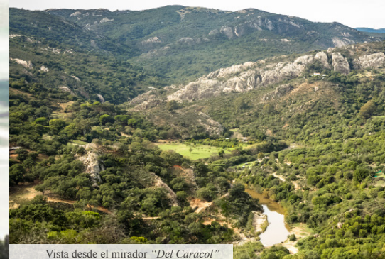
Vista desde el mirador “ Del Caracol ”

Para finalizar el recorrido de forma completa es aconsejable no marcharse sin visitar el mirador “ De Jimena de la Frontera ” (8), el cual ofrece una fascinante panorámica de la ciudad y alguno de sus monumentos más emblemáticos.