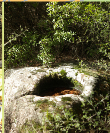
Lagar cercano al mirador "De Jimena de la Frontera"