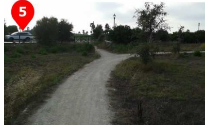
Otra entrada al sendero, frente a la Parroquia Nuestra Señora de Europa