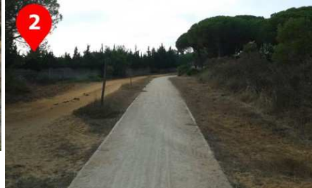
Pasamos por la parte trasera del Centro Deportivo Hipotels, a nuestra izquierda.