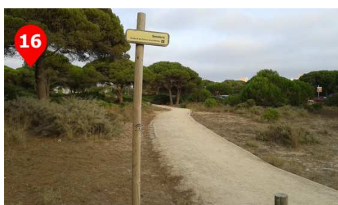
Llegamos al final del recorrido, a la espalda de un restaurante y zona de columpios y merendero.