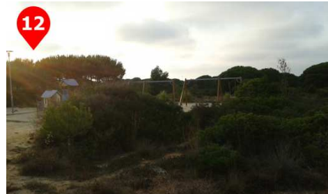
Llegaremos a los columpios, con una tirolina para los más pequeños