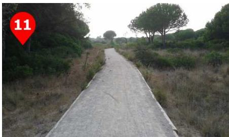
No tendrás problemas para seguir el sendero