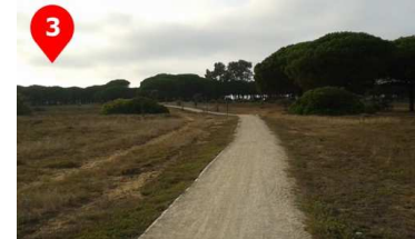
En el primer cruce de caminos giraremos a nuestra izquierda