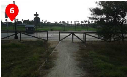
Cruzaremos la carretera (Cañada de los Carabineros) hacia el campo de golf