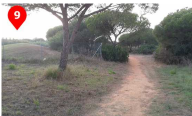
Seguimos el sendero