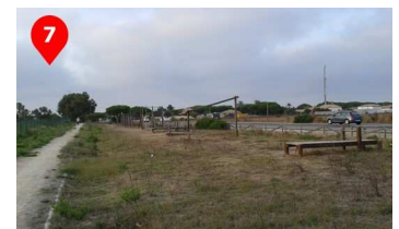
Pista Americana, a nuestra izquierda el campo de golf