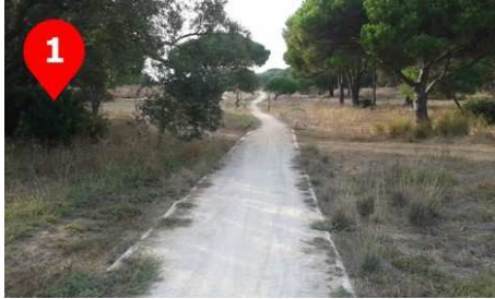
El Punto de partida se sitúa en la Colada de Fuente Amarga