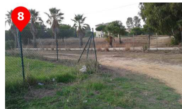
Giramos a nuestra izquierda bordeando el vallado del campo de golf