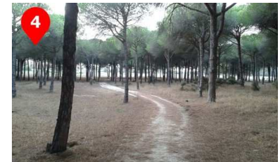
Cruzando la formación de pinos