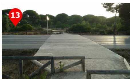
Cruzamos la calle ceuta