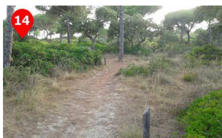
Para adentrarnos en el Pinar de la Barrosa