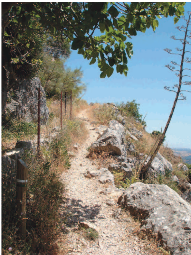
Sendero junto a la alambrada

y carboneros volando entre sus copas. También vemos otras especies vegetales como el gordolobo, la aulaga y la lechetrezna... Pocos minutos después llegamos a la presa. Este pequeño embalse se construyó ante el déficit de agua potable que sufre la población en la época estival. Aún siendo esta zona una de la de mayor pluviosidad de toda la Península, la estacionalidad y el carácter torrencial de las lluvias, hacen que la temporada seca sea muy larga. En este punto termina nuestro recorrido, ya que el acceso a la presa está restringido.