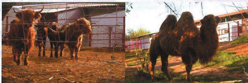
Camello y especies exóticas junto a Magallanes

Pasado este punto, la Cañada continúa hacia el frente atravesando la Carretera de Cortes, pero nuestro itinerario se desvía hacia la izquierda por el Camino del Canal para transitar por el mismo durante tres kilómetros aproximadamente.