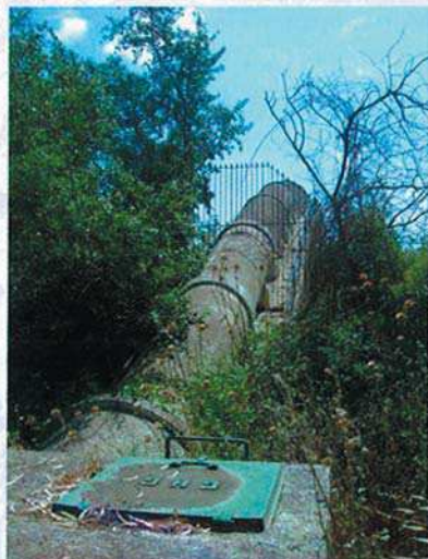
Acueducto de los Hurones